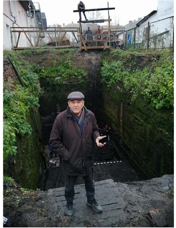
Иоанновский раскоп, конец октября 2022. Близится завершение работ.

Исследования 2022 года на Иоанновском раскопе раскрыли к северу от средневековой мостовой Большой Пробойной улицы границу Немецкого двора и нашли место въезда в факторию.