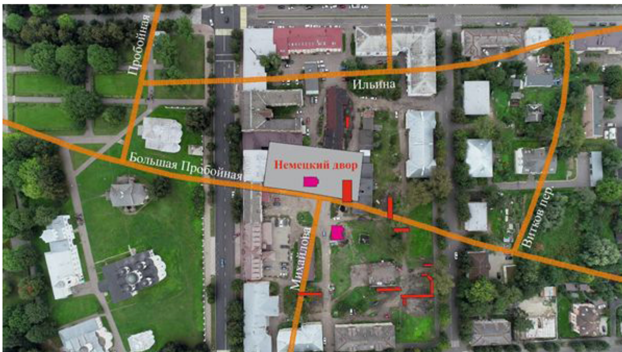
Квартал 38 Великого Новгорода и прилегающие территории. Отмечены трассы средневековых улиц, руинированные церкви и археологические раскопы 2020–2022 годов