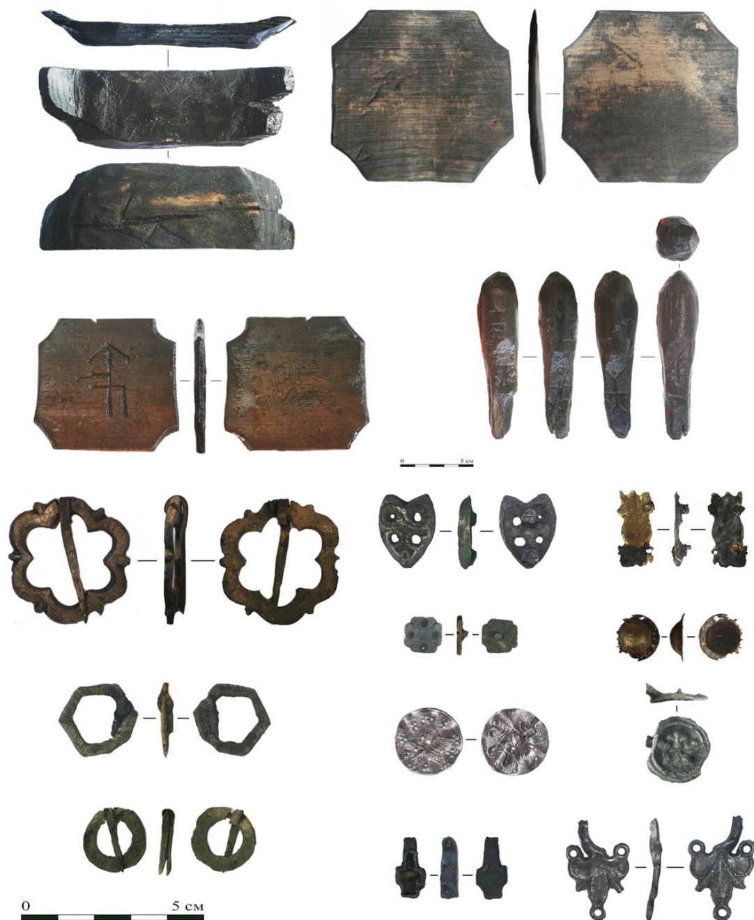
Находки: предметы с владельческими знаками, пряжки, накладки, жетон, крест

Среди находок археологи обнаружили редко встречающиеся артефакты. Найдено значительное количество предметов с владельческими купеческими знаками (Hausmarke). Купцы маркировали ими различные предметы, в том числе крышки дубовых бочек с товарами. Ранее подобные находки были сделаны при раскопках Готского двора в 1968–1970 годах.