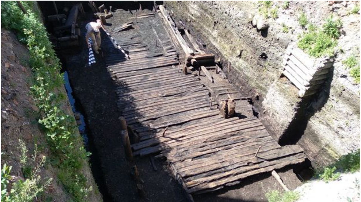
Вид на раскоп

Торговый устав (скра, «Schra», «Schrage»), который регламентировал торговлю Новгорода с ганзейским союзом, предписывал немецким купцам останавливаться в Новгороде на территории, принадлежащий Ганзе, – Готском и Немецком дворах. Там же купцы должны были хранить товары и вести торговлю. Согласно описанию в новгородской писцовой книге конца XVI века, Немецкий двор находился к востоку от Ярославова дворища, между средневековыми улицами Большая Пробойная и Ильина, в квартале между современными улицами Большая Московская, Ильина, Михайлова и Никольская. Также было известно, что на Немецком дворе стояла каменная церковь святого Петра.