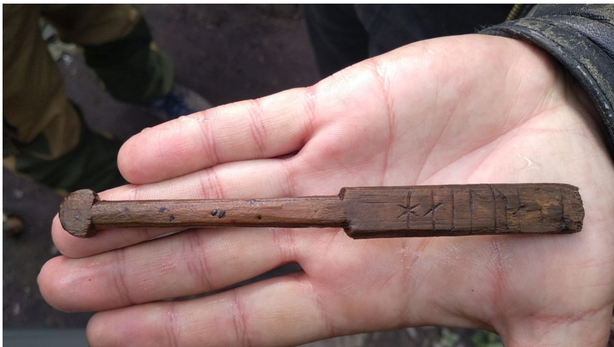
Находка с рунической надписью